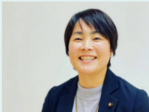
薩摩川内市議会議員