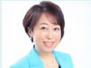
上智大学 教授 パリテ・アカデミー共同代表